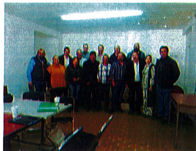
Jueves 29 Reunión con Derse Supervisores de Zona y Directores Nivel Primaria y Secundaria Oficinas Derse