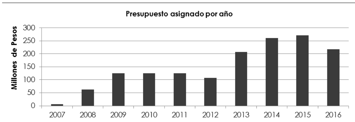
Gráfica 2. Monto anual del presupuesto (en millones de pesos) asignado al programa "Llega" 2007-2012, al programa "Apoyo al Transporte para Estudiantes" 2013-2015 y al programa "Bienevales para Estudiantes" 2016

En 2014 el Programa "Bienevales para Estudiantes" amplió su área geográfica de atención, ya que en 2013 operaba únicamente en la Zona Metropolitana de