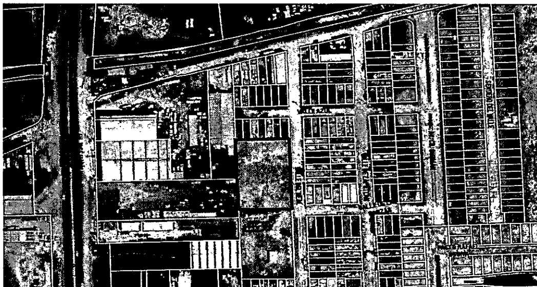
Figura 1 Localización del Predio