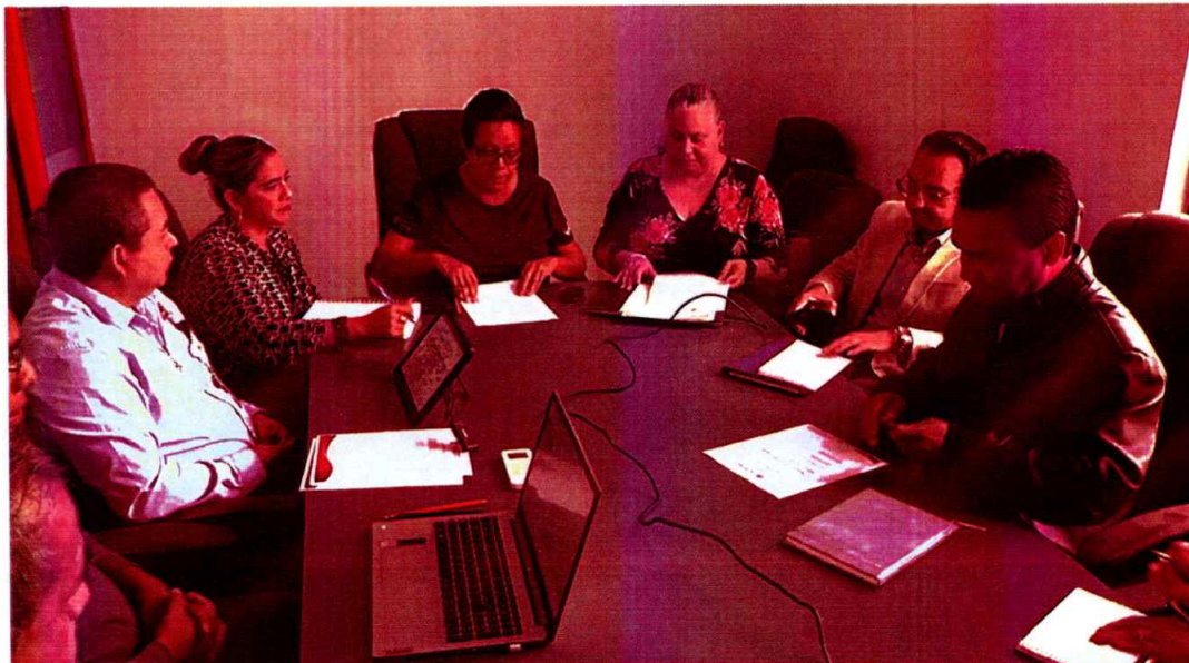
PARTE 2: https://www.youtube.com/watch?v=T2OuWeYYCdI