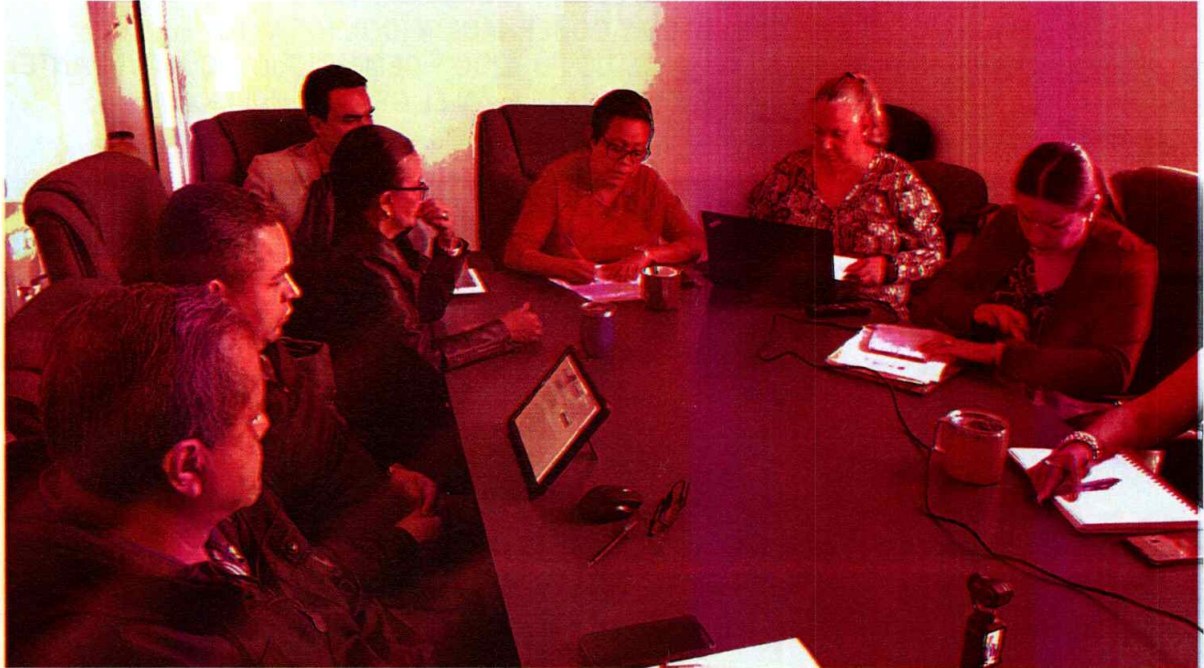
PARTE 3: https://www.youtube.com/watch?v=UjUmGD7FgxY&t=8s